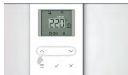
3. Still inn klokke og dato. Dette behøver du kun å gjøre på den første romtermostaten. De andre blir synkronisert mot den første.