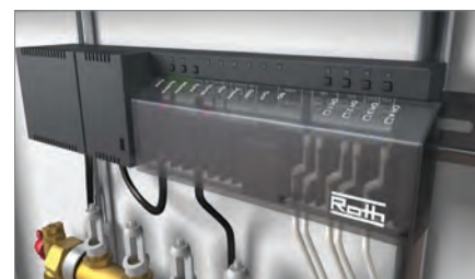
1. Monter kontrollenheten og koble til reguleringsmotorer.

Med Touchline har vi utviklet et system som har lang levetid. Samtidig kan alle plastmaterialer i termostaten gjenbrukes 100%. Software oppdatering via SD kort gir et fremtidsrettet system.