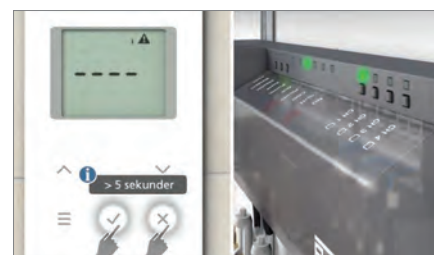
2. En-to-meldt inn: Velg kanal på kontroll-enheten og meld inn romtermostaten med ett trykk så er du klar.