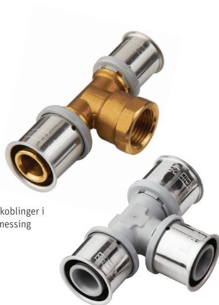
Presskoblinger i DZR messing